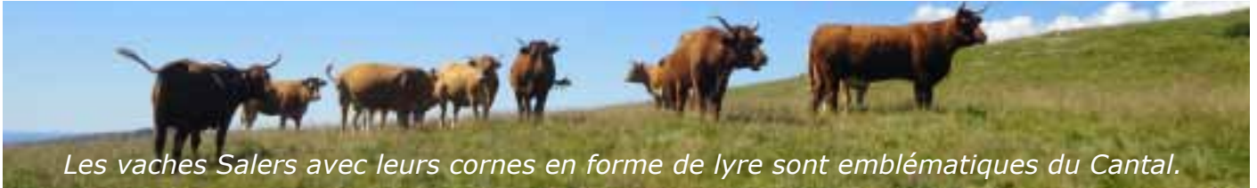
Les vaches Salers avec leurs cornes en forme de lyre sont emblématiques du Cantal.

Rendez-vous à l'hôtel à Thièzac à partir de 18h. Après installation dans les chambres, un pot d'accueil vous sera offert. Nous aurons l'occasion de faire plus ample connaissance et nous discuterons du déroulé du séjour. Si besoin, nous ferons aussi un point sur le contenu des sacs de randonnée ainsi que sur les bagages qui seront transportés par notre taxi. Enfin, nous irons dîner tous ensemble au restaurant. Dîner et nuit au gîte de Lafon ou un autre hébergement à Thièzac.