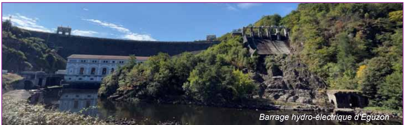
Barrage hydro-électrique d'Eguzon