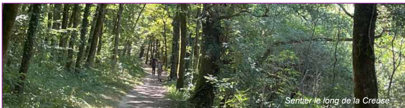
Sentier le long de la Creuse