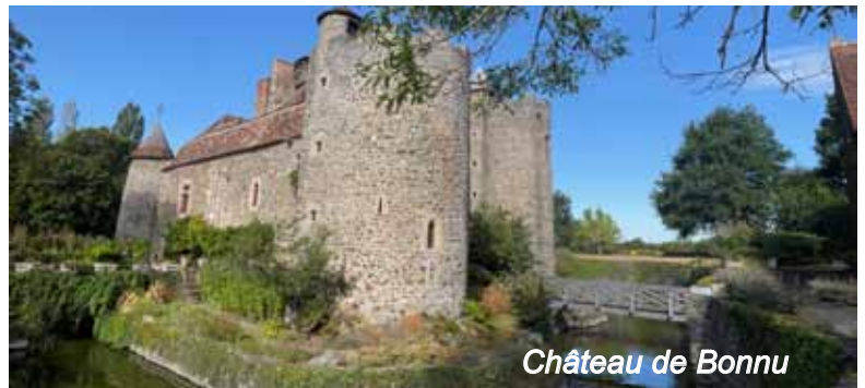
Château de Bonnu

Si les conditions le permettent, vous aurez la possibilité d'assister à une visite commentée des parties extérieures du barrage. Vous pourrez admirer le château de Bonnu