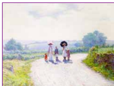
A country walk - Paul DEWHURST