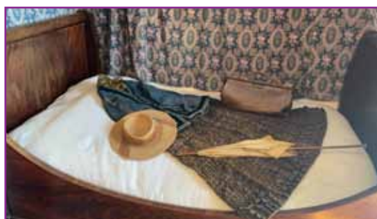
La maison de Georges Sand