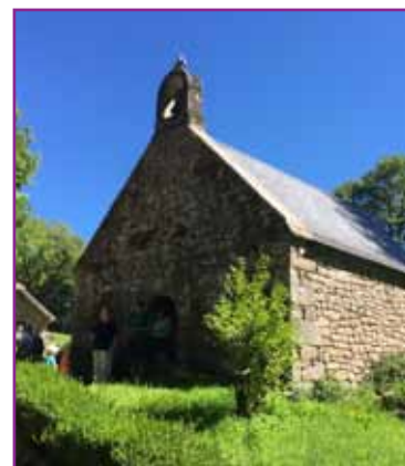
Le village abandonné de Clédât

Distance : 17 km - D+ : 560 m - 5h30 de marche