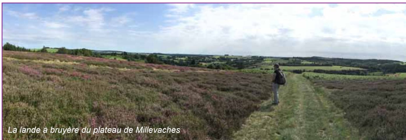
La lande à bruyère du plateau de Millevaches

Distance : 19 km - D+ : 620 m - 6h30 de marche