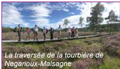
La traversée de la tourbière de Négarioux-Malsagne

Après un passage par la maison du PNR Millevaches en Limousin, nous irons aux sources de la Vienne.