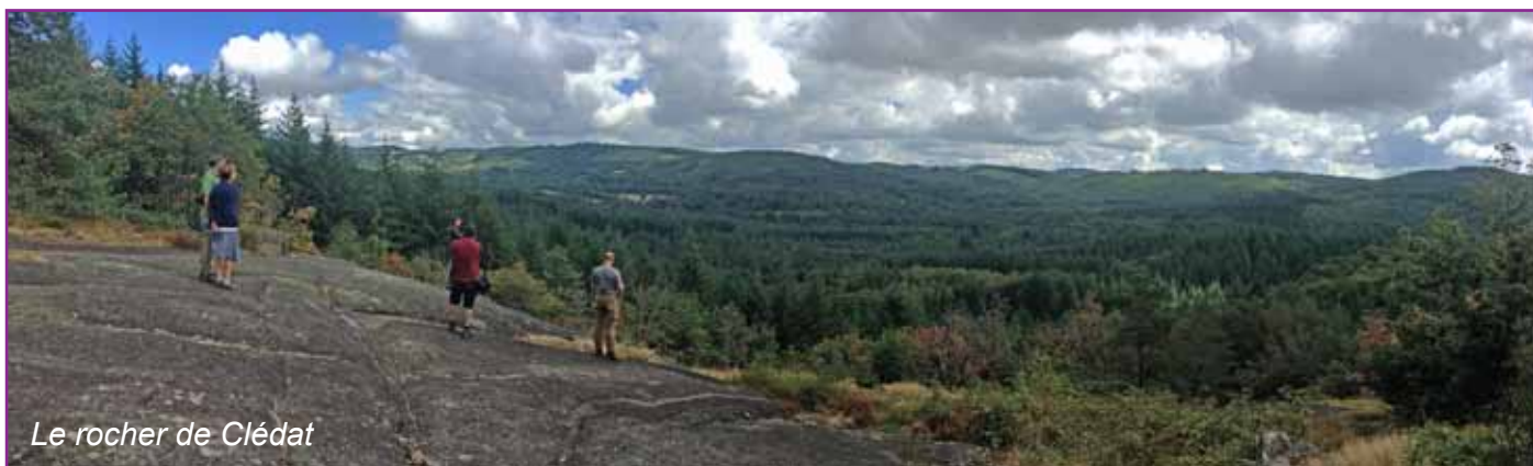
Le rocher de Clédât

Une semaine de nature commence ! Distance : 6,5 km - D+ : 350 m - 3 heures de marche