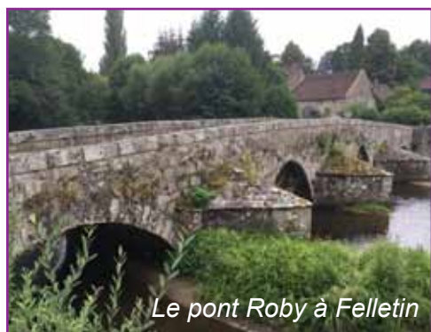
Le pont Roby à Felletin

Pour cette dernière étape nous vous proposons une descente douce par la vallée de la Creuse. Nous arriverons en fin de matinée à Felletin.