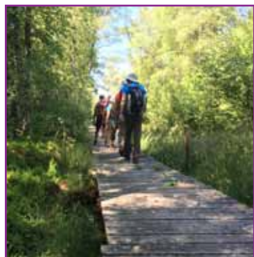
Traversée de tourbière

Pour cette dernière étape nous vous proposons une descente douce par la vallée de la Creuse. Nous arriverons en fin de matinée à Felletin afin de profiter d'une visite.