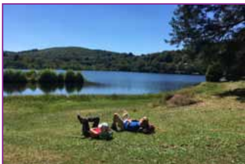
Pause au lac de Peyrelevade

Après un passage par la maison du PNR Millevaches en Limousin, nous irons aux sources de la Vienne avant de pique-niquer au bord du lac de Peyrelevade.