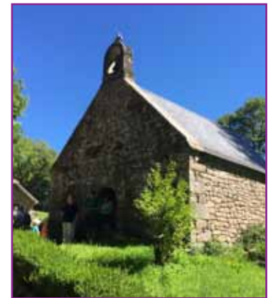
Le village abandonné de Clédât

Distance : 17 km - D+ : 560 m - 5h30 de marche