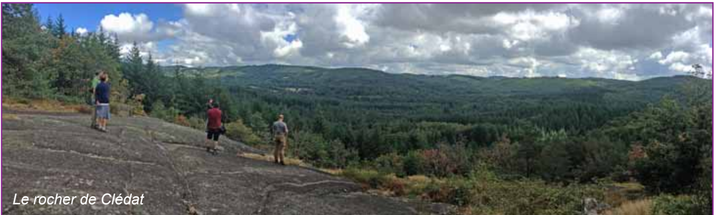
Le rocher de Clédât

Distance : 6,5 km - D+ : 350 m - 3 heures de marche