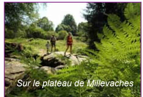
Sur le plateau de Millevaches

Carte postale d'époque : la tacot corézien sur le viaduc des rochers noirs