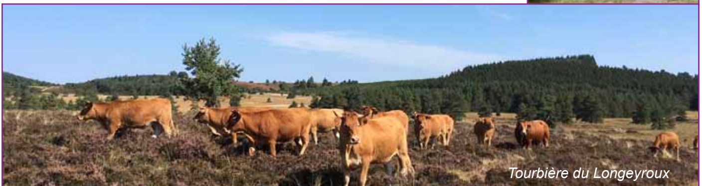
Tourbière du Longeyroux