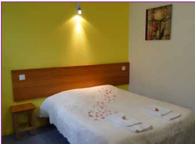
Le village vacances «Le Lac» à Egleton