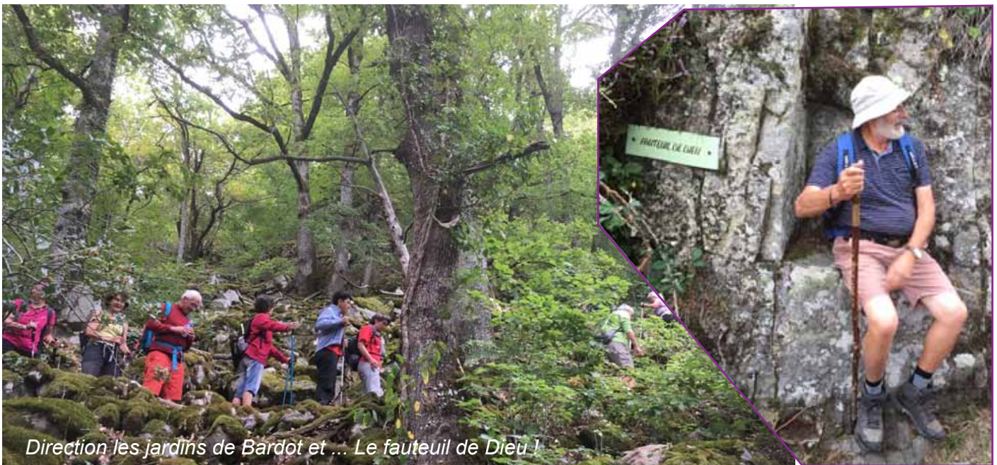
Direction les jardins de Bardot et ... Le fauteuil de Dieu !