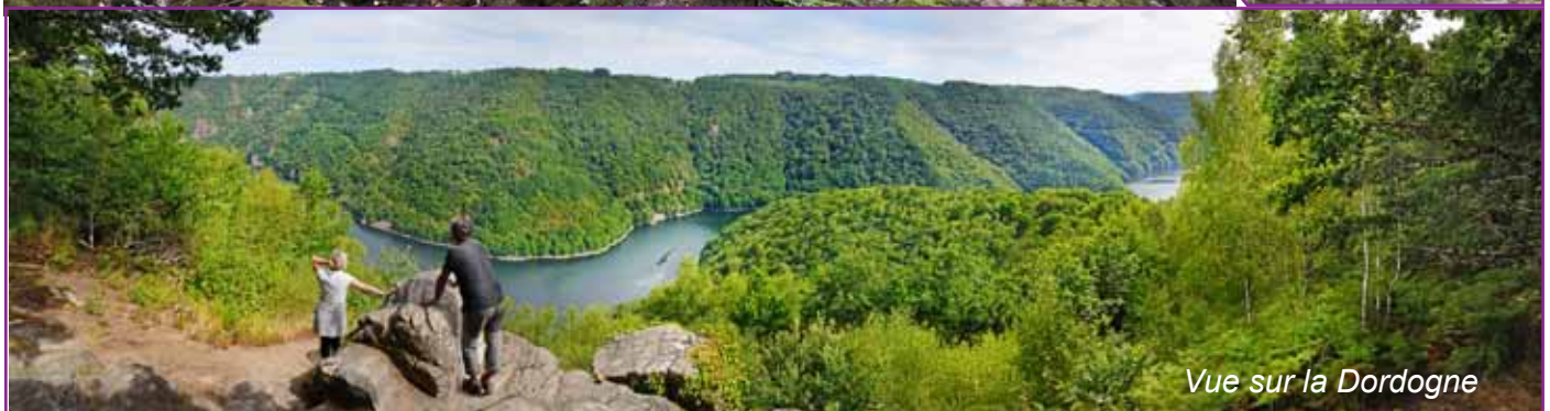
Vue sur la Dordogne