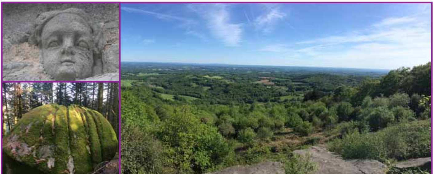
En haut à gauche, à la chapelle de Grandmont - En bas à gauche, chaos granitique - à droite, vue du site de la pierre branlante