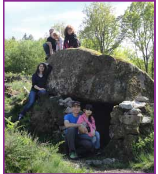
Loge de berger dans la tourbière des Dauges

6,5 Km - 170 dev+ - environ 3h de marche